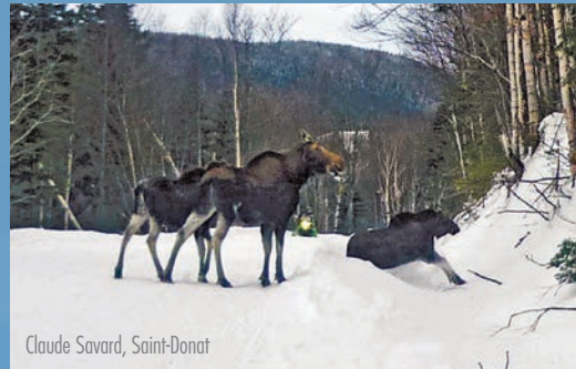
Claude Savard, Saint-Donat